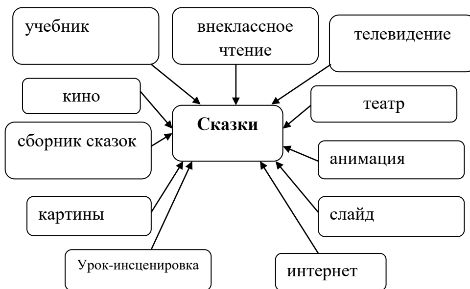
Рисунок 2.1.1. Система взаимосвязи средств в изучении сказок

В ходе нашего исследования выявлена тесная связь сказок со следующими средствами обучения: (Рисунок 2.1.1.)